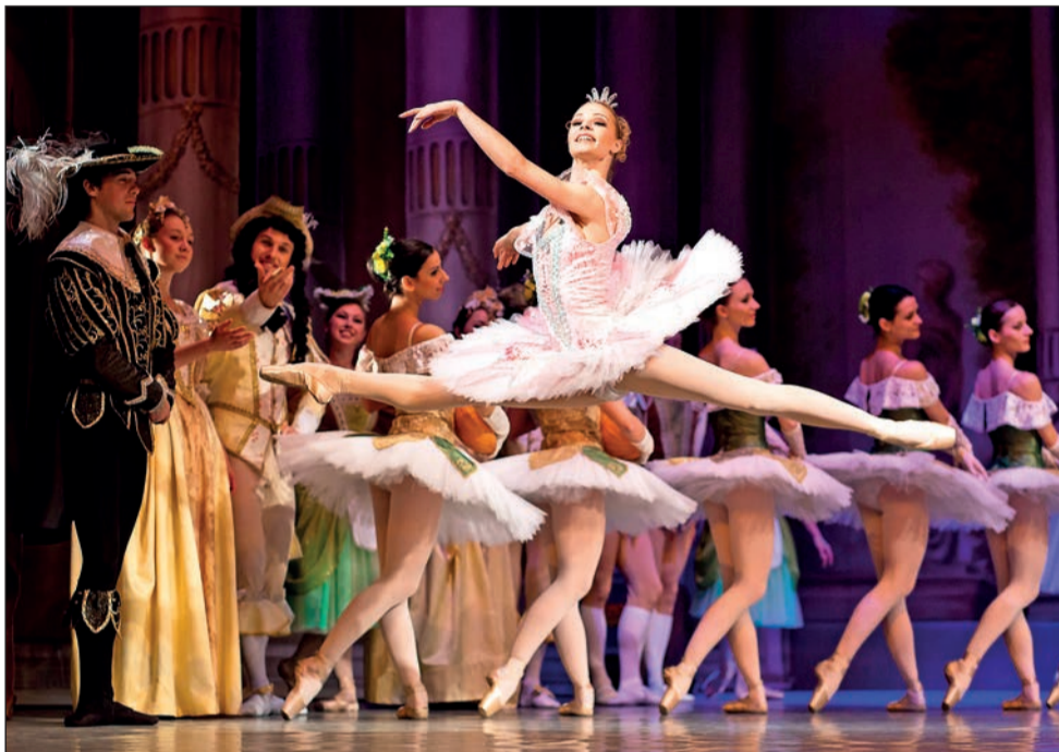
□ Balet Spící krasavice splňuje všechny tři atributy klasického baletu - nabízí krásnou a působivou hudbu, výborné taneční výkony a výpravou scénou. Dospěli jsou i s dětmi zváni v neděli 15. března.

Představení je s ohledem na náročnost scény a tanečních výkonů, výpravu i množství tanečnicků uváděno s hudební nahrávkou. Jeho délka je 2.20 h.