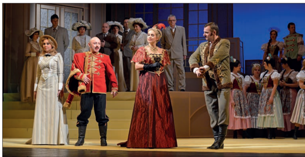
□ Maďarská národní opereta, jak bývá Hraběnka Marica nazývána, potěší festivalové publikum v neděli 22. března.